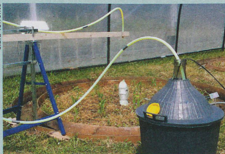
Les polluants qui s'infiltrent dans le sol sont collectés et analysés.