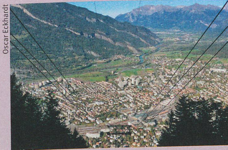
La même langue se parle désormais de Malans à Thusis en passant par Coire.