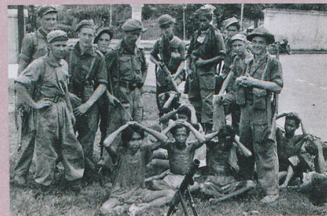
Des soldats néerlandais posent sur l'île de Java avec des prisonniers de guerre.

R. Limpach: Business as usual: Dutch mass violence in the Indonesian war of independence 1945-49, in: B. Lutikhuis et al. (Eds.): Colonial Counterinsurgency as Mass Violence. The Dutch Empire in Indonesia. Routledge, New York, 2014