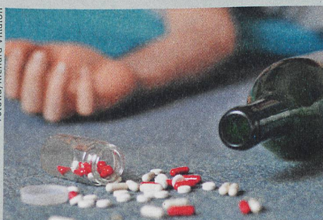
Un accès restreint aux médicaments pourrait empêcher certains suicides.

P. Pfeifer et al.: Acute and chronic alcohol use correlated with methods of suicide in a Swiss national sample. Drug and Alcohol Dependence (2017)