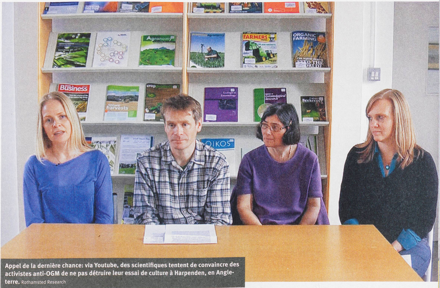
Appel de la dernière chance: via Youtube, des scientifiques tentent de convaincre des activistes anti-OGM de ne pas détruire leur essai de culture à Harpenden, en Angleterre.