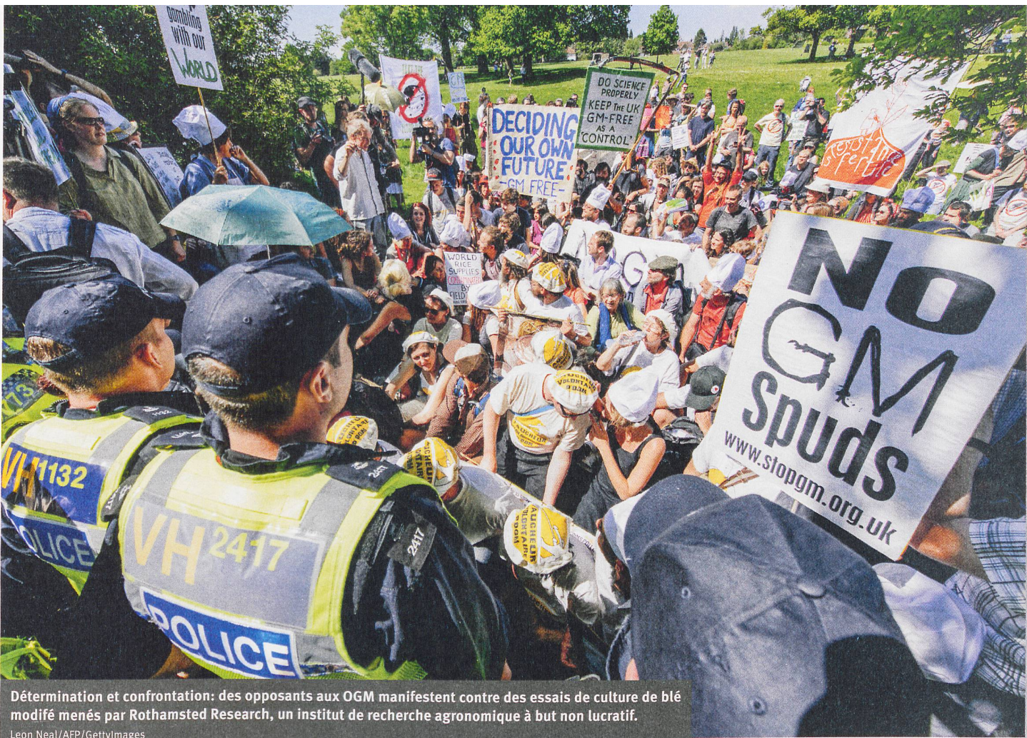
Détermination et confrontation: des opposants aux OGM manifestent contre des essais de culture de blé modifié menés par Rothamsted Research, un institut de recherche agronomique à but non lucratif.