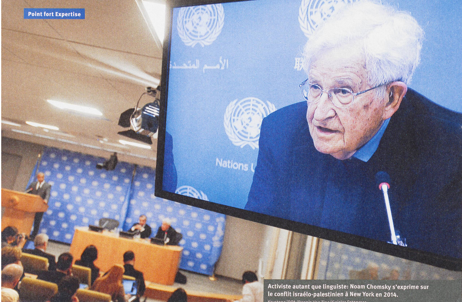
Activiste autant que linguiste: Noam Chomsky s'exprime sur le conflit israélo-palestinien à New York en 2014.