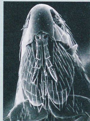
La puce a commencé à transmettre la peste déjà à l'âge du bronze.