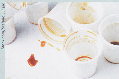
Consommer de la caféine pour se réveiller? Cela ne marche pas forcément.