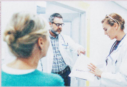
Utiliser «nous» au lieu de «je» encourage les employés à contredire leurs supérieurs.