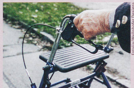
Certains seniors rejettent le déambulateur, symbole de déclin physique.

F. Rickli: Old, disabled, successful? Transfiguration of people with disabilities within positive aging paradigms in Switzerland. In: Medical Anthropology Theory (in preparation)