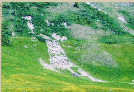
Une pente érodée dans la vallée d'Urseren, notamment à cause de l'élevage bovin.