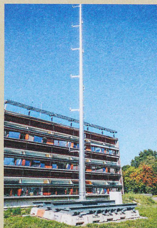
Mesure du vent à différentes altitudes: le campus de l'EPFL, modèle de canyon urbain.