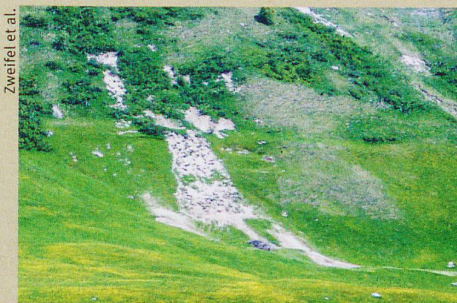
Une pente érodée dans la vallée d'Urseren, notamment à cause de l'élevage bovin.

L. Zweifel et al.: Spatio-temporal pattern of soil degradation in a Swiss Alpine Grassland. Remote Sensing of Environment (2019)