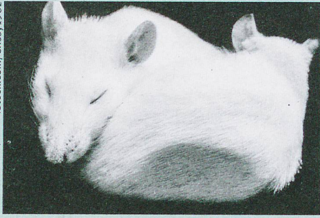
Dormir assez préserve la santé et la sveltesse des souris et certainement des hommes aussi.