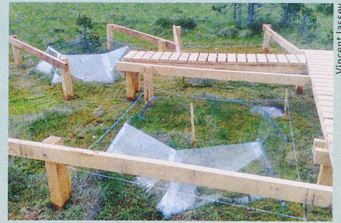
Serres en plexiglas à toit ouvert pour simuler le réchauffement dans la tourbière.