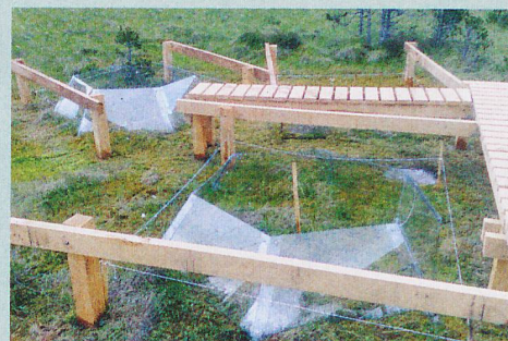
Serres en plexiglas à toit ouvert pour simuler le réchauffement dans la tourbière.

P. M. et al.: Altered circulating endocannabinoids in anorexia nervosa during acute and weight-restored phases: A pilot study. European Eating Disorders Review (2019)