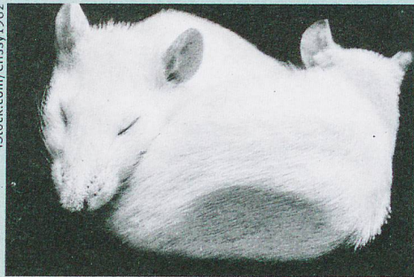
Dormir assez préserve la santé et la sveltesse des souris et certainement des hommes aussi.