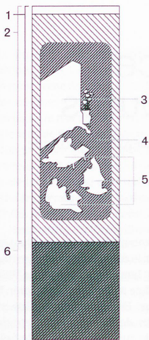
Ce panneau (XVIIIe et XIXe) a été restauré par le Musée historique de Lausanne sous la direction du conservateur Claude-Alain Künzi. Le paravent mesure 2,40 m de haut et les panneaux 63 cm de large chacun.