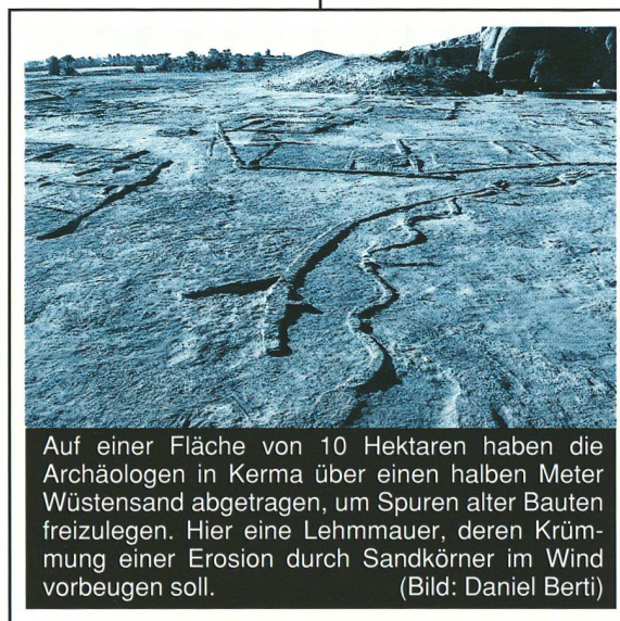
Auf einer Fläche von 10 Hektaren haben die Archäologen in Kerma über einen halben Meter Wüstensand abgetragen, um Spuren alter Bauten freizulegen. Hier eine Lehmmauer, deren Krümmung einer Erosion durch Sandkörner im Wind vorbeugen soll.

jedoch völlig im Dunkeln bezüglich der Herkunft und des genauen Standorts dieser Zivilisation... Aus den archäologischen und historischen Daten lässt sich ableiten, dass die Blütezeit der nubischen Kultur mit dem Niedergang des Pharaonenreiches zusammenfiel. Umgekehrt verlor Kerma an Bedeutung, als dieses an Macht gewann. Während die Archäologen die Vergangenheit des alten Kerma heraufbeschwören, stossen ihre Helfer, 80 Erdarbeiter aus dem Sudan, ganz unvermutet mit ihrer eigenen Kulturgeschichte zusammen. Sie haben