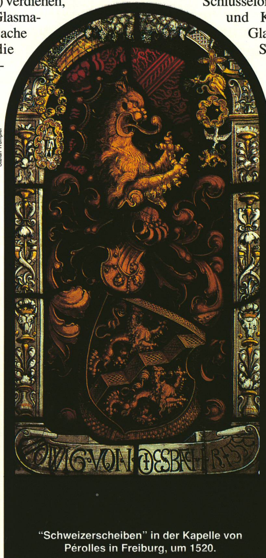
"Schweizerscheiben" in der Kapelle von Péroles in Freiburg, um 1520.

Aus Anlass der 700-Jahr-Feier der Eidgenossenschaft zeigt das Museum für Glasmalerei in Romont (Kanton Freiburg) von März bis November 1991 eine Ausstellung unter dem Titel: "26 Kantone – 26 Glasgemälde".