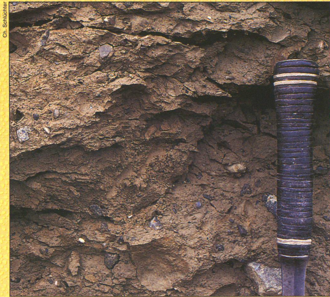
Hier kam der eiszeitliche Aaregletscher durch! Beweis seiner Passage ist diese Grundmoräne, abgelagert unter der Sohle des vorrückenden Eisstroms. Sie besteht aus einer sandig-tonigen Grundmasse von bräunlicher Farbe, in der Gesteinsbruchstücke aller Grössen und von verschiedenen Herkunftsorten eingelagert sind (Kalke, Sandsteine, Granite, Gneise...)

Einerseits stützen sich die Grubenbetreiber auf geologisches Fachwissen – andererseits liefern Abbaustellen wertvolle Informationen über die Beschaffenheit der obersten (und damit auch jüngsten) Erdkruste.