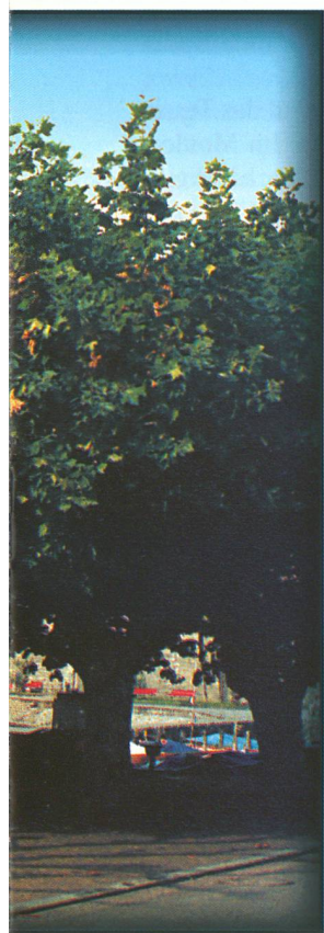
Universität de Neuchâtel