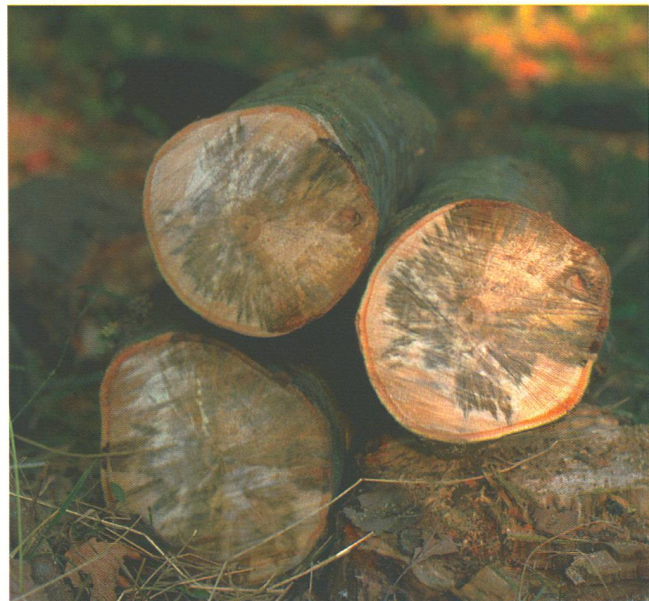
Das Holz verfärbt sich schwarz: Der Platanenkrebs dringt bis zum Kern des Baumstammes vor.

Die Wirkung von Juglonen auf lebende Pflanzen ist verblüffend: Innert weniger Stunden werden die Blätter schwarz. Naphthalenone hingegen entfalten ihre Wirkung erst nach drei Tagen. Eine Hypothese: Könnten