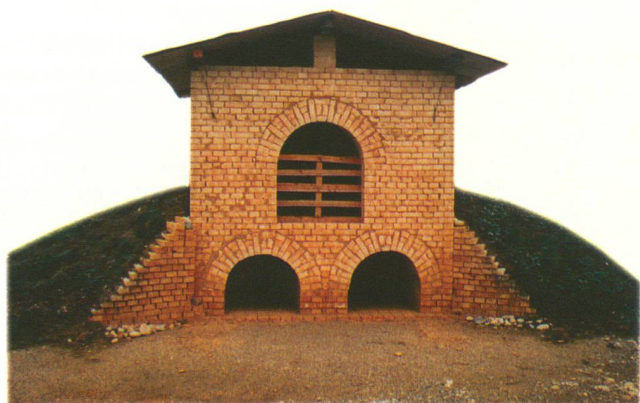
Der von den Forschern konstruierte handwerkliche Brennofen in den Gärten des Klosters von St. Urban.

Die Wissenschaftler zeigen sich beeindruckt von der Qualität der Backsteine, die auch 700 Jahre nach ihrer Herstellung noch in einem ausgezeichneten Zustand sind! Zum Vorschein gekommen ist auch eine reiche Mannig-