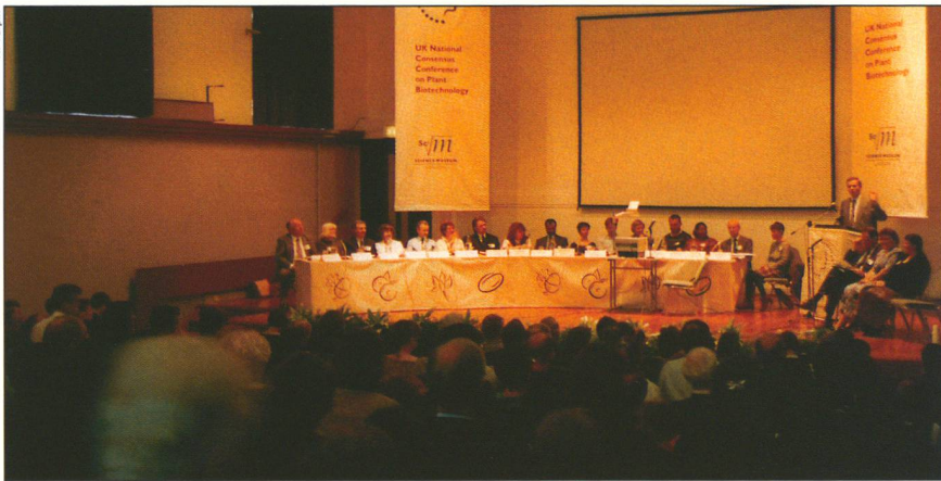
Britische Konsenskonferenz von 1994 im Londoner Naturwissenschafts-Museum.

schers Ebene zu treffenden Entscheidungen. Das Publikum spricht den Politikern die Kompetenz dazu ab, und auch diese selber fühlen sich überfordert, weil sie von der Sache zu wenig begreifen. Die Fachleute wiederum – also die Wissenschaftler und Ingenieure – beklagen sich, ihre Aussagen würden von den ohnehin zu emotionalen Reaktionen neigenden Adressaten nicht genügend verstanden. Um ein Vertrauensverhältnis