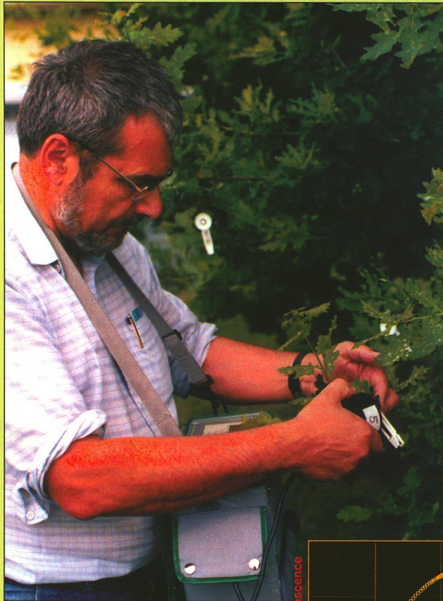
Eine Stunde vor der Messung wurden die Blätter dieser Eiche stellenweise durch weisse Klammern von der Lichtzufuhr abgeschirmt. Die Grafik zeigt, wie ein Pflanzenblatt auf zwei kurze, in sechs Sekunden Abstand erfolgte Lichtstösse (1 und 2) mit Fluoreszenz reagiert.

Platzes im Laubwerk recht unterschiedlichen Umweltinflüssen ausgesetzt. Solche Messungen lassen sich nur im Gelände vornehmen. Deshalb haben die Schweizer Forscher die britische Firma Hansatech gebeten, ein tragbares Fluorimeter zu entwickeln. Das Gerät von der Grösse einer Pastmilchpackung enthält eine Lichtquelle, einen Empfänger und viel Elektronik.