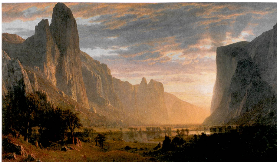
Birmingham Museum of Art, Alabama; Gift of the Birmingham Public Library

Wolf Linder, Christian Bolliger, Yvan Rielle (Hg.): Handbuch der eidgenössischen Volksabstimmungen 1848 bis 2007. Haupt-Verlag, Bern 2010, 755 S. Die Online-Datenbank swissvotes.ch bildet eine Ergänzung zum Handbuch.