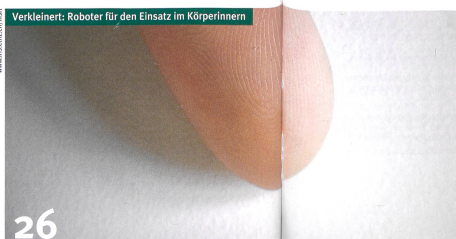
Verkleinert: Roboter für den Einsatz im Körperinnern

S. H. / P. / A. / B. / C. / D. / E. / F. / G. / H. / I. / J. / K. / L. / M. / N. / O. / P. / Q. / R. / S. / T. / U. / V. / W. / X. / Y. / Z.