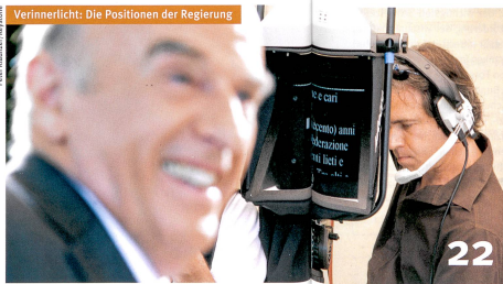
Verinnerlicht: Die Positionen der Regierung