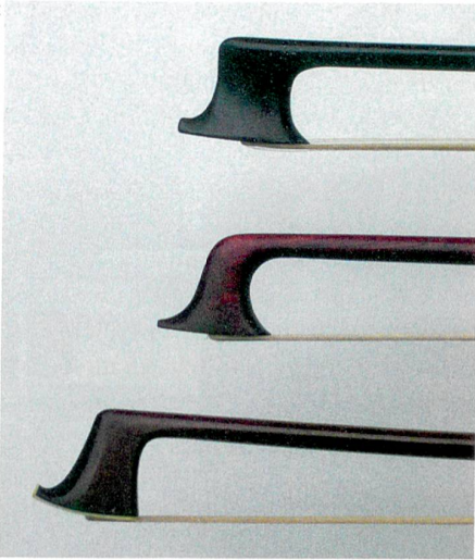
Erzeugen unterschiedliche Klänge: Drei Geigenbögen aus der ersten Hälfte des 19. Jahrhunderts.