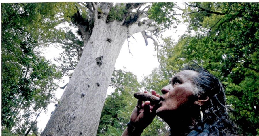
Können Pflanzen hören? Ein Angehöriger der Maori führt Besucher durch den Waipoua-Wald, ein Musikinstrument spielend (Neuseeland, 2010).