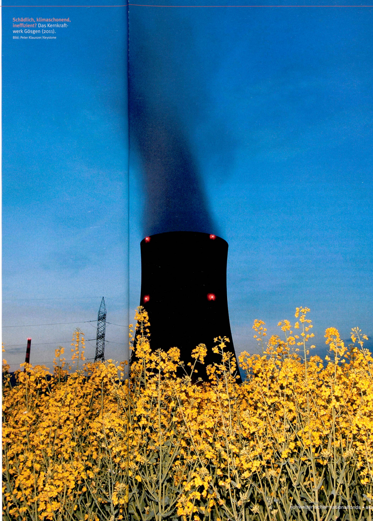
Schädlich, klimaschmend, ineffizient? Das Kernkraftwerk Gösgen (2011).