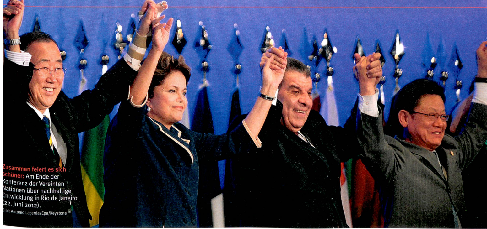
Zusammen feiert es sich schöner: Am Ende der Konferenz der Vereinten Nationen über nachhaltige Entwicklung in Rio de Janeiro (22. Juni 2012).