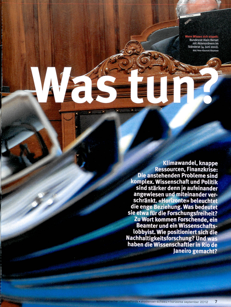
Wenn Wissen sich stapelt: Bundesrat Alain Berset mit Aktenordnern im Ständerat (4. Juni 2012).