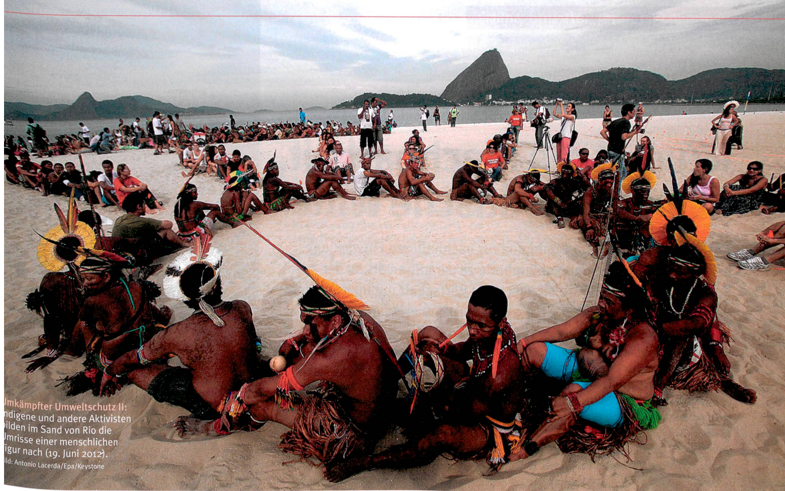
Umkämpfter Umweltschutz II: Indigene und andere Aktivisten bilden im Sand von Rio die Umriss einer menschlichen Figur nach (19. Juni 2012).

werden. Ursprünglich war nicht von multidisziplinären, sondern von wissenschaftlichen Experten die Rede. «Gerade in der Biodiversität ist viel regionales und traditionelles Wissen vorhanden», sagt Larigauderie. IPBES wolle die Qualität des oft nur mündlich tradierten, nicht statistisch analysierten Wissens bewerten und dieses einbeziehen.