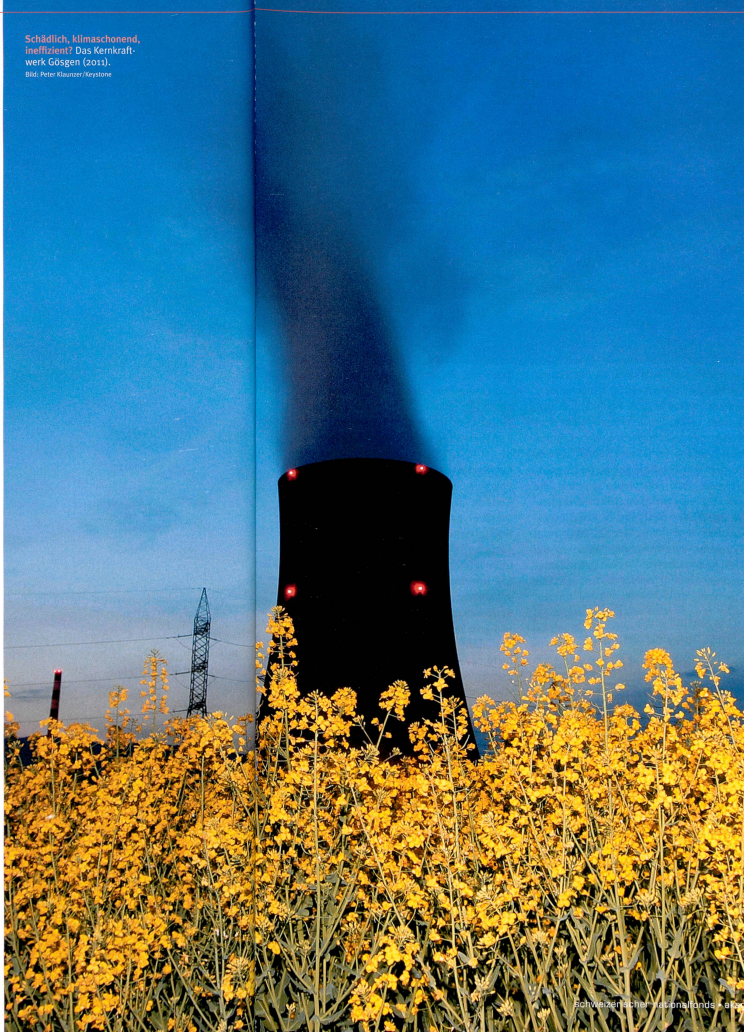
Schädlich, klimaschmend, ineffizient? Das Kernkraftwerk Gösigen (2011).