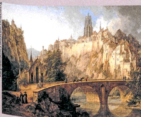
Romantisches Gegenbild zur Moderne: In seiner «Ansicht von Fribourg» (1826) blendet Domenico Quaglio den technischen Fortschritt, die Industrialisierung und die Massenarmut aus.

B. Roeck, M. Stercken, F. Walter, M. Jorio, T. Manetsch (Hg.): Schweizer Städtebilder. Urbane Ikonographien (15.–20. Jahrhundert) – Portraits de villes suisses. Iconographie urbaine (XVe–XXe siècle) – Vedute delle città svizzere. L'iconografia urbana (XV–XX secolo). Chronos, Zürich 2013, 640 S., 400 farbige Abb.