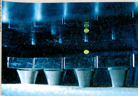
Kontaktlose Reaktionen: Die Akustophorese verstärkt die fluoreszierende Emission einer Chemikalie (grün).

D. Foresti, M. Nabavi, M. Klingauf et al. (2013): Acoustophoretic contactless transport and handling of matter in air. Proceedings of the National Academy of Sciences of the United States of America (doi:10.1073/pnas.1301860110/-/DCSupplemental).