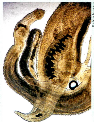
Parasiten in Aktion: Beim Pärchenegel liegt das Weibchen – nicht leicht erkennbar – teilweise im Männchen.