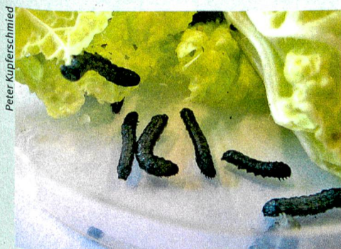
Biologischer Pflanzenschutz: Die Larven der Baumwollwelle, eines Agrarschädlings, verzehren Blätter, die mit insektiziden Bakterien behandelt wurden.