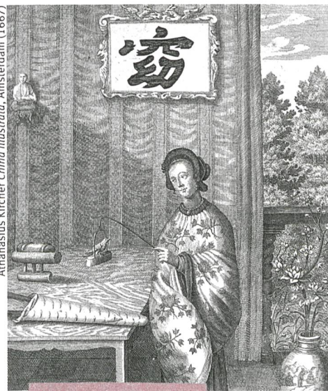
Kultur und Gesellschaft

38 Frauen, Konkubinen und Jesuiten Wie prägten jesuitische Missionare im China des 17. Jahrhunderts die Beziehungen zwischen Männern und Frauen?