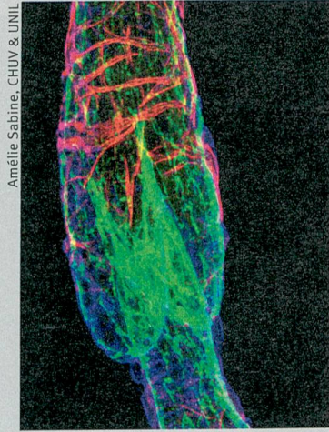
Einbahnstrasse: Auch diese Lymphklappe verhindert, dass Flüssigkeit zurückfließt.