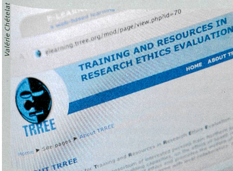
Ethik online: Auf TRREE sind rechtliche Bestimmungen für klinische Versuche einsehbar.