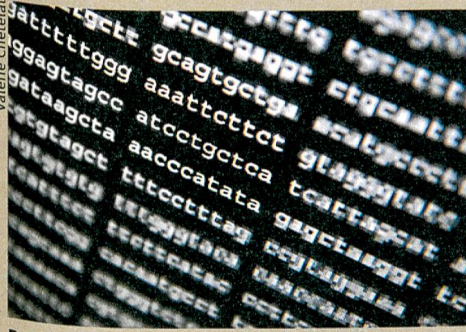
Daten auf DNA speichern: Zu fast hundert Prozent zuverlässig.

J.M. Tomczak, L.V. Pourovskii, L. Vaugier, A. Georges, S. Biermann. Rare-earth vs. heavy metal pigments and their colors from first principles. PNAS (2013): 110, 3.