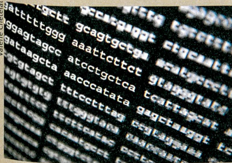
Daten auf DNA speichern: Zu fast hundert Prozent zuverlässig.

J.M. Tomczak, L.V. Pourovskii, L. Vaugier, A. Georges, S. Biermann. Rare-earth vs. heavy metal pigments and their colors from first principles. PNAS (2013): 110, 3.