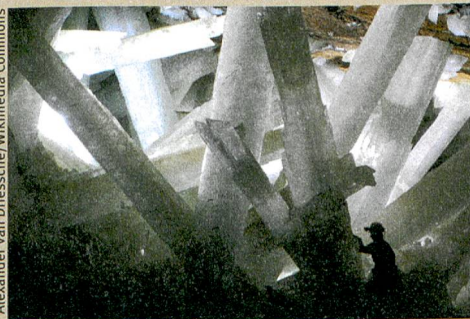
Forscher im Wunderland: Gipskristalle in der mexikanischen Mine Naica.

Y. Krüger, J. M. García-Ruiz, À. Canals, D. Martí, M. Frenz, A.E.S. Van Driessche. Determining gypsum growth temperatures using monophasic fluid inclusions – Application to the giant gypsum crystals of Naica, Mexico. Geology (2013): 41, 2, 119–122.