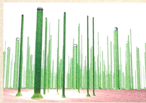
Höchst effizient: Solarzelle aus Nanodrähten und Siliziumsubstrat.