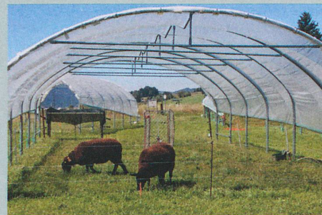
Mit dem Gewächshaustunnel simulierten die Forscher einen sehr trockenen Sommer.

C. Deléglise et al.: Drought-induced shifts in plants traits, yields and nutritive value under realistic grazing and mowing managements in a mountain grassland. Agriculture, Ecosystems & Environment (2015)