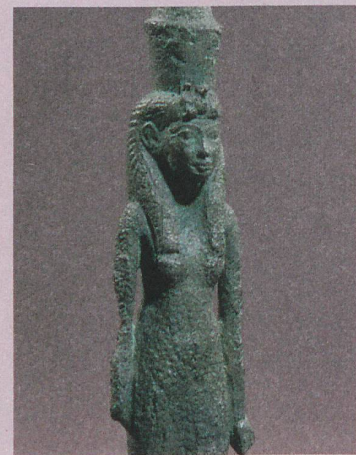
Trustees of the British Museum

M. Luiselli: Escaping fear and seeking protection. On the role of Mut in New Kingdom personal religion , in: Ch. Zivie-Coche (Ed.): Le rôle de l'individu dans la religion égyptienne. Cahiers «Égypte Nilotique et Méditerranéenne» , 2016