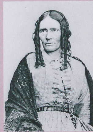
Mary Elizabeth Barber stellte mit ihren Erkenntnissen indirekt feministische Forderungen.