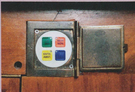
Durch die elektronische Abstimmung wird genau nachvollziehbar, wer sich wie entschieden hat.