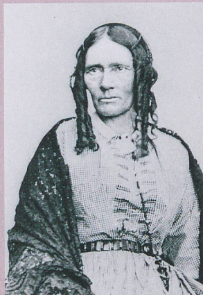
Mary Elizabeth Barber stellte mit ihren Erkenntnissen indirekt feministische Forderungen.