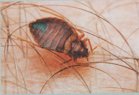
Ungemütliche Bettgenossen: Die Blutsauger werden immer resistenter gegen Insektizide.