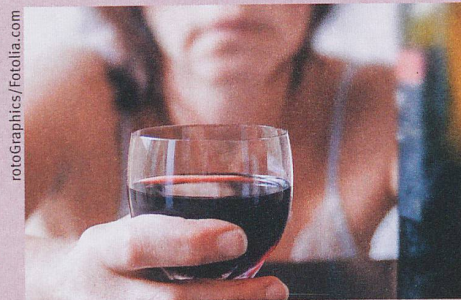
Manchmal erfolgt der Griff zum Glas aus Langeweile.