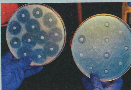
Multiresistente Bakterien (rechts) halten eine wachsende Zahl von Antibiotika in Schach.