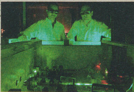
Mit Lasern stellen die PSI-Forscher langwellige Lichtblitze her.