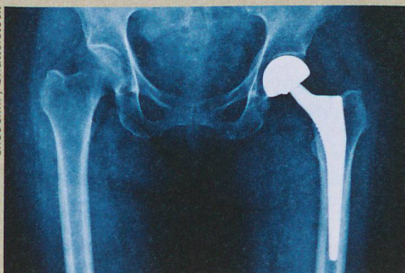
Mit silberhaltigen Nanokügelchen könnten Bakterien von Hüftgelenken ferngehalten werden.