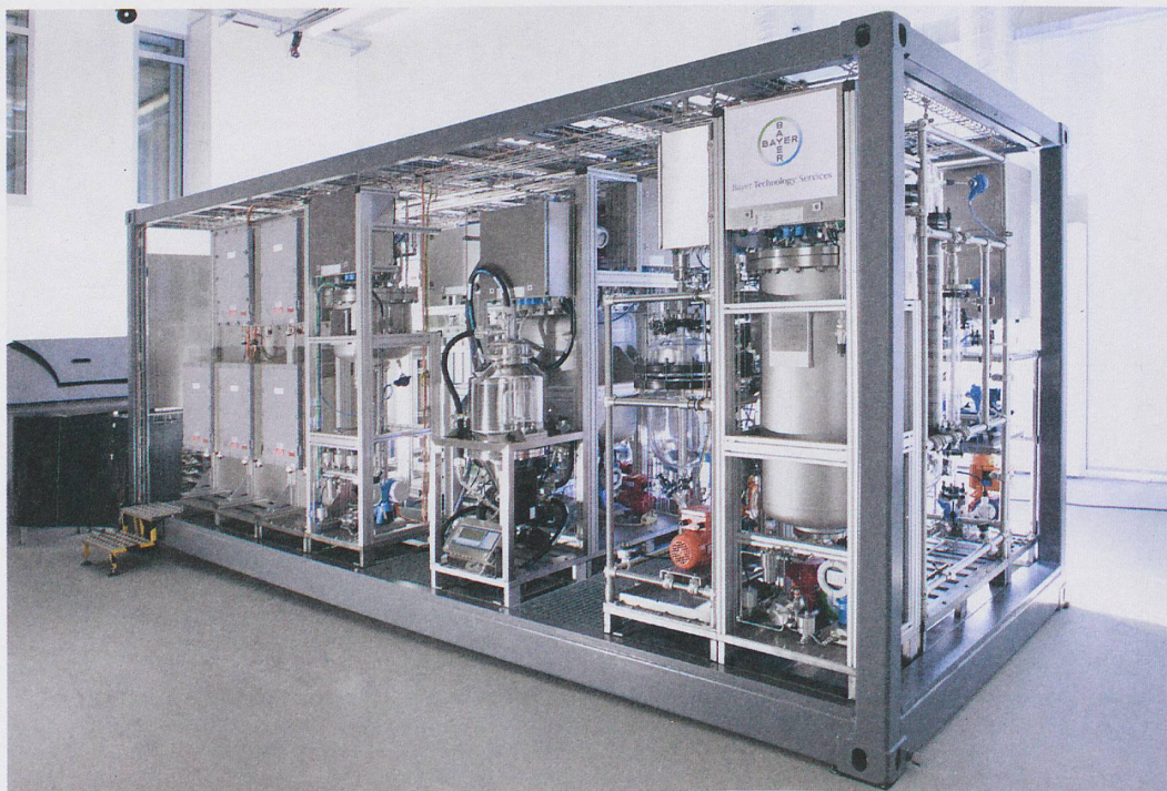
Eine standardisierte Minifabrik, transportierbar im Container: Dies ist die Vision des europäischen Forschungsprojekts F3-Factory.