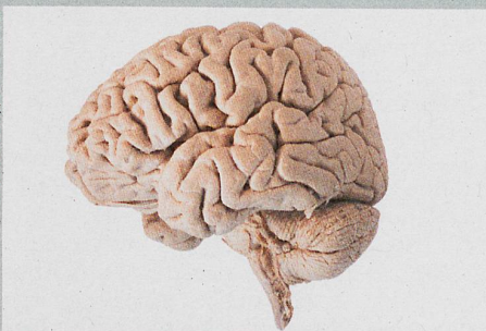
Nicht alle Hirnwindungen sind gleich, aber manche sind gleicher.

G.E. Doucet et al.: Person-Based Brain Morphometric Similarity is Heritable and Correlates With Biological Features. Cerebral Cortex (2018)