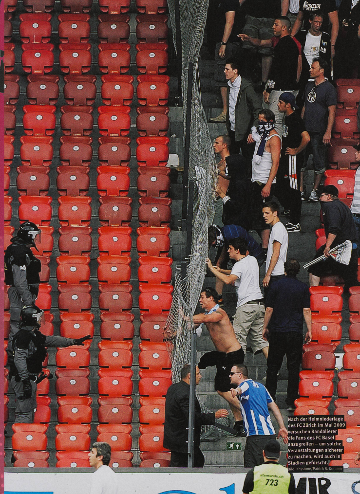
Nach der Heimniederlage des FC Zürich im Mai 2009 versuchen Randallierer die Fans des FC Basel anzugreifen – um solche Veranstaltungen sicherer zu machen, wird auch in Stadien geforscht.

Hochschulinstitut für Internationale Studien und Entwicklung (HEID), Genf Friedensförderung