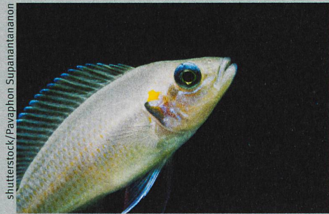
Soll ich mein Revier verteidigen? Die Entscheidung ist nur selten genetisch vorbestimmt.