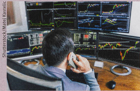
Spekulationsirrtümer sind nicht das alleinige Werk von Börsenhändlern.