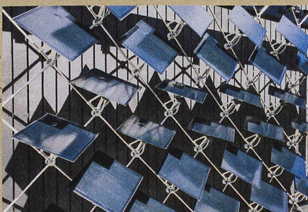
Wie eine Sonnenblume: Die beweglichen Fotovoltaik-Elemente richten sich nach der Sonne aus.

Chair of Architecture and Building Systems, ETH Zürich