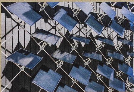
Wie eine Sonnenblume: Die beweglichen Fotovoltaik-Elemente richten sich nach der Sonne aus.

B. Svetozevic et al.: Dynamic photovoltaic building envelopes for adaptive energy and comfort management. Nature Energy (2019).