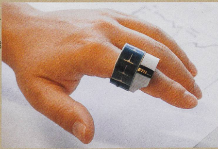
Wer dieses Mini-Pulsoximeter trägt, weiss über seine Vitalfunktionen Bescheid.