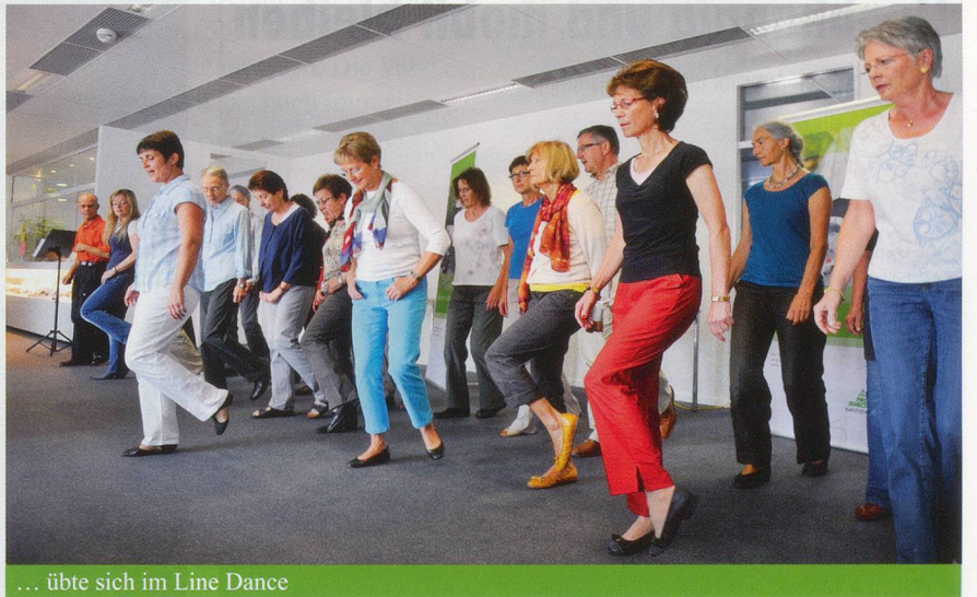
... übte sich im Line Dance