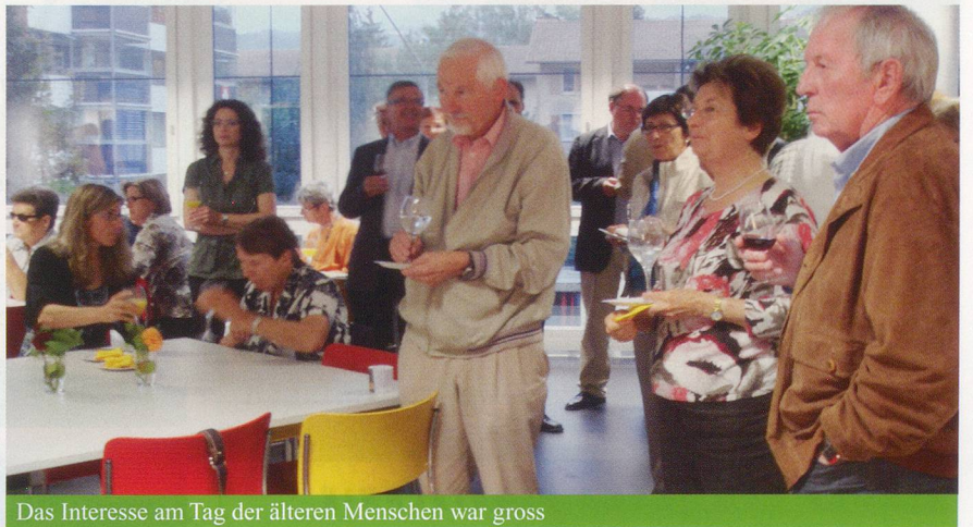
Das Interesse am Tag der älteren Menschen war gross