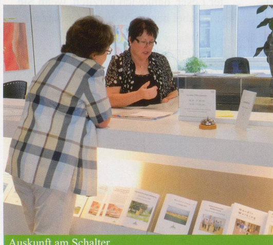
Auskunft am Schalter

Alfred Müller AG, asexs Architekten AG, Cilag GmbH International, MediBank, Valiant, Victor Hotz AG