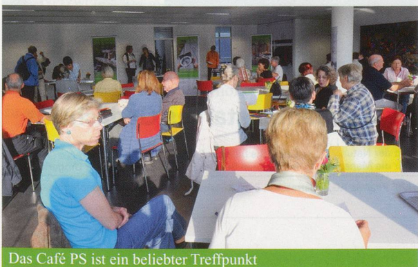
Das Café PS ist ein beliebter Treffpunkt