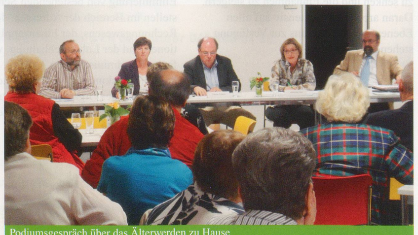
Podiumsgespräch über das Älterwerden zu Hause