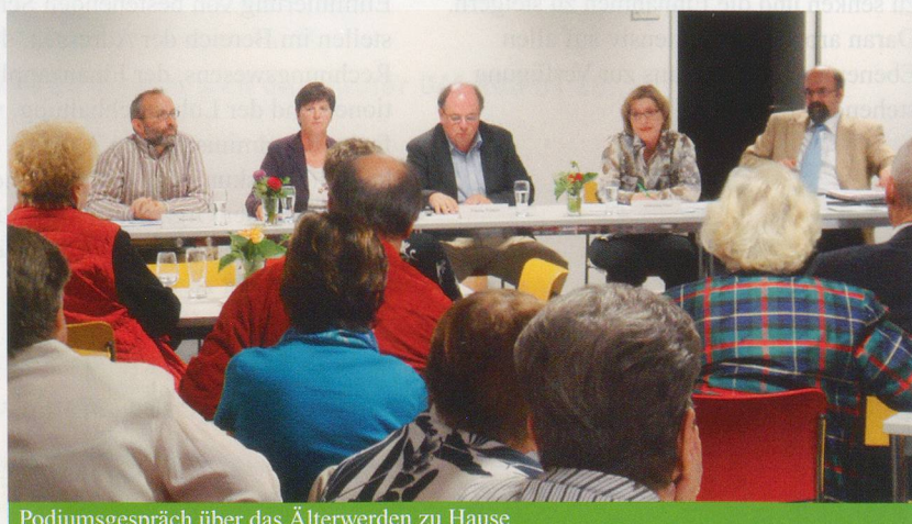
Podiumsgespräch über das Älterwerden zu Hause