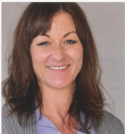
Bereichsleiterin Bildung und Kultur ab 1. April 2011

Bewegung ist für alle Menschen der Grundstein, gesund älter zu werden. Wenn Sie dies noch mit Freude in einer Gruppe Gleichgesinnter tun können, ist Bewegung sogar doppelt so schön und wirksam.