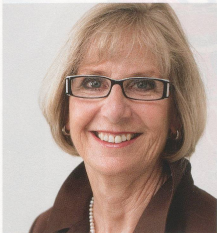
Bereichsleiterin Bewegung und Sport ab 1. Januar 2011