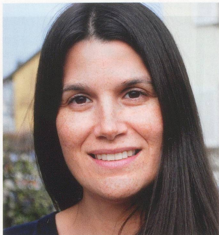
Mitarbeiterin Hilfen zu Hause ab 1. April 2011