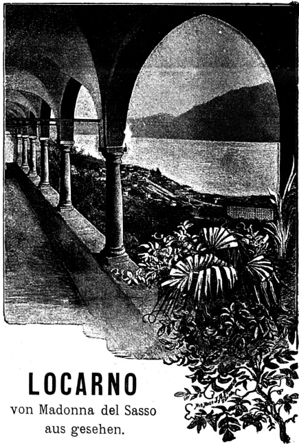
LOCARNO von Madonna del Sasso aus gesehen.

Klingt es nicht wie Hohn, wenn man unter der Abbildung rechts liest: „Locarno von Madonna del Sasso aus gesehen.“ Sollte es nicht eher heissen: „Locarno bei Nacht?“ Nein; denn auch diese Bezeichnung klinge noch höhnisch, weil Locarno sogar bei Nacht schöner ist, als Figura zeigt. Kaum dass man die Säulen des Wandelganges des Minoritenklosters Madonna del Sasso auf der Zeichnung unterscheidet, abgesehen davon, dass das Cliché allein einen Raum von ca. 80 Petitzeilen à 20—25 Ct. die Zeile umfasst. Unsere inserierenden Leser mögen diese Auseinander-